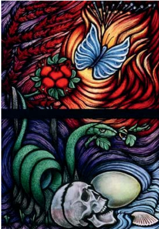
„Osterfischen. AMEN“ von Ernst Alt