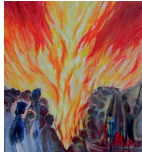
„Pfingstkreuz“ von Karola Onken

Dieses Liedheft ist Eigentum der Pfarrei Bruder Klaus, Gundelfingen. Bitte nicht mitnehmen und nach Verwendung zurücklegen. Vielen Dank!