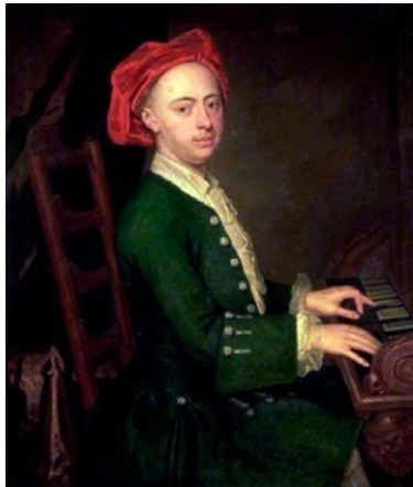
Georg Friedrich Händel um 1720 ("Chandos Porträt")

te seines Könnens: Von der empfindsamen Continuo-Arie über kunstvollen Kontrapunkt, überraschende harmonische Wendungen (Juravit) und virtuose Koloraturen bis hin zu einer teils sehr bildhaften Textausdeutung (conquassabit) fordert er sein Publikum immer wieder ganz neu heraus. Neben der Herausstellung seines eigenen kompositorischen Könnens und dem repräsentativen Glanz, der einer gottesdienstlichen Feier eines Kardinals würdig war, diente diese Art von Musik auch dem höheren Ziel der Verherrlichung eines siegreichen Gottes und einer über die (muslimischen) Heiden triumphierenden Kirche.