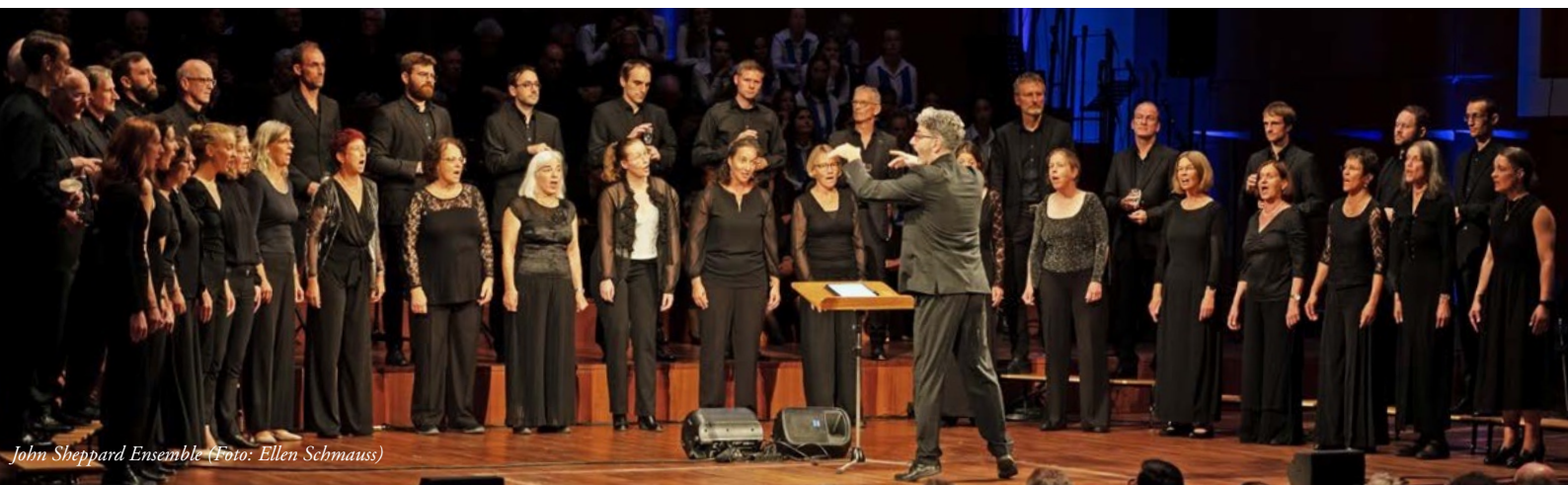
John Sheppard Ensemble