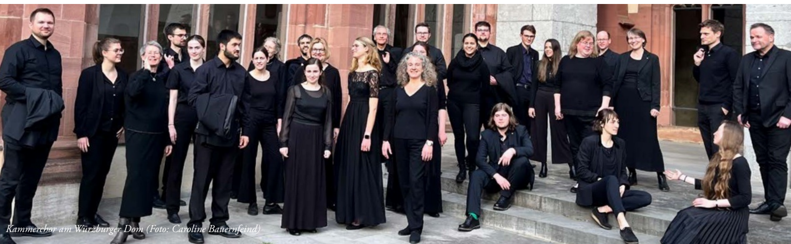
Kammerchor am Würzburger Dom